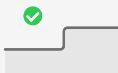
Schwellen bis 20 cm