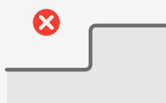
Schwellen ab 20 cm