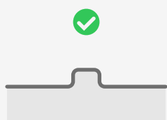
Freistehende Schwellen bis 5 cm 1